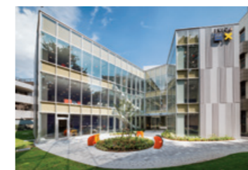
⑩ JSR・慶應義塾大学 医学化学イノベーションセンター (通称JKiC)