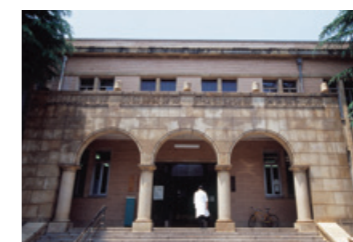
⑯ 北里記念医学図書館 (信濃町メディアセンター)